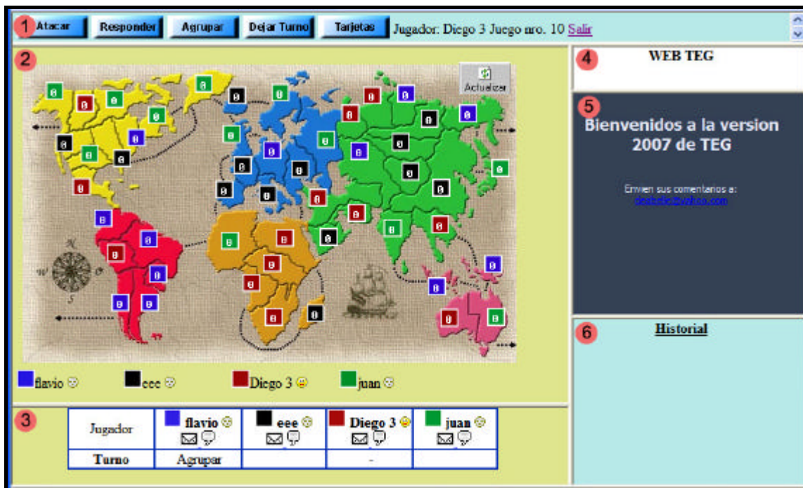
Pantalla de juego de Webteg.

Esta pantalla dispone de varias secciones: